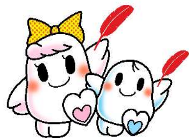
赤い羽根共同募金シンボルキャラクター “愛ちゃん”と“希望くん”