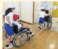
生活用車いす体験

福祉や障害は特別なことではなく、一人ひとりが身近なこととして感じ、「知るこゝろ」で興味・関心を持ち、相手のことを思いやる気持ちを育む「キッカケ」をつくるため、福祉共育啓発講座を実施しています。