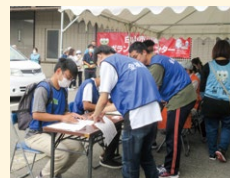
災害ボランティアセンター開設・運営訓練の様子

大規模な災害等が発生した際、白山市災害対策本部との連携の下、白山市社会福祉協議会が災害時のボランティア活動を支援するために「災害ボランティアセンター」を設置します。