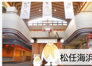
松任海浜温泉おつかいさま