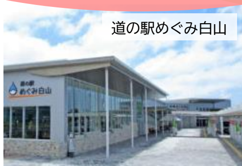
道の駅めぐみ白山