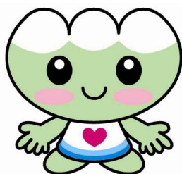
白山市社会福祉協議会 マスコットキャラクター 「ふくちゃん」