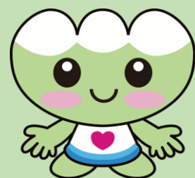
白山市社協マスクットキャラクター 「ふくちゃん」